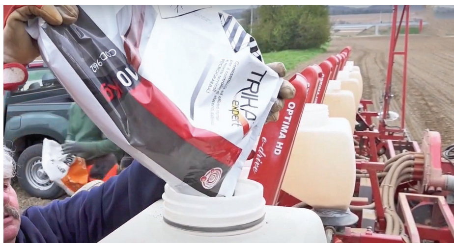
1.kép TRIKA EXPERT bemutató üzemi kezelés – X.SUMIVERSITAS ( Balatonújlak, 2021.)

2022-ben kerül Magyarországon piacra a Sumi Agro új talajfertőtlenítő rovarölőszere a TRIKA EXPERT. A készítményt már több gazdálkodó személyesen is ismeri, mert hivatalos nagyüzemi kezelésben kipróbálhatta 2021-ben.