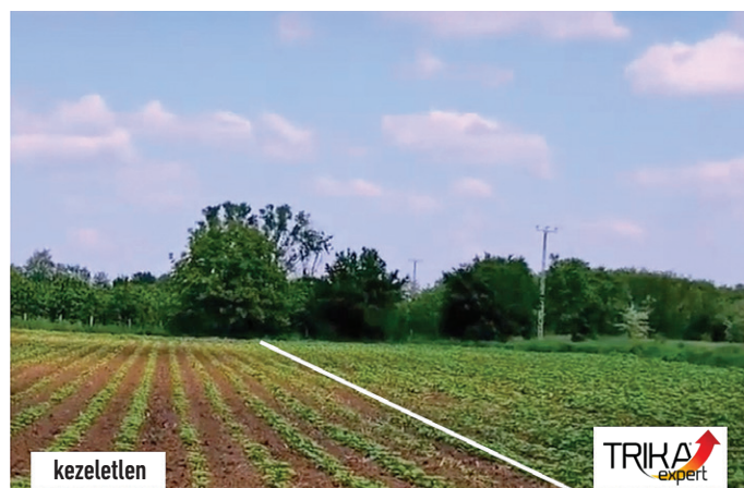
5. kép A TRIKA EXPERT starter hatása napraforgón – Nyírtelek, 2021.

A kelő növények gyökerei számára különösen fontos a felvehető foszfortartalom, ami gyakran még kiváló foszforellátottságú talajokon sem biztosított. Ezt a gyorsan felvehető foszfort biztosítja a TRIKA EXPERT . Kijuttatásánál törekedjünk arra, hogy a granulátumot a gyökérszónába juttassuk ki, mert a gyökér csak 2 mm távolságból képes a foszfor felvételére.