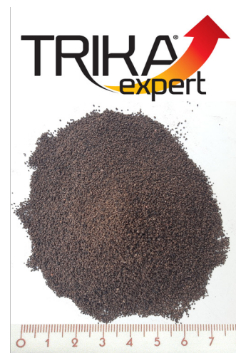
2.kép 5 g TRIKA EXPERT 25 000 granulátumot tartalmaz.

Az üzemi kezelések az ország több pontján, 10 napraforgó és 10 kukoricatáblán kerültek beállításra. A kísérleti eredményeket és üzemi tapasztalatokat országos bemutatón 2021. június 16-án a X.SUMIVERSITAS keretében osztottuk meg a kollégákkal.